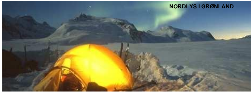
Nordlys over Ilulissat, overnatning med femstjernet udsigt

Det er ikke alle, der har lyst til det, men der sker noget helt vidunderligt i øjeblikket, hvor du giver slip og leger sammen med naturen. Og her er der vitterlig tale om at lege sammen med naturen og ikke i naturen. Om du er fem, 30 eller 70 år, prøv det!