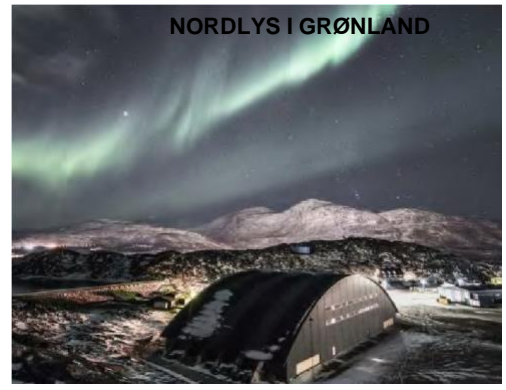
Nordlys ved Ilulissat, nordlys over Ilulissat,