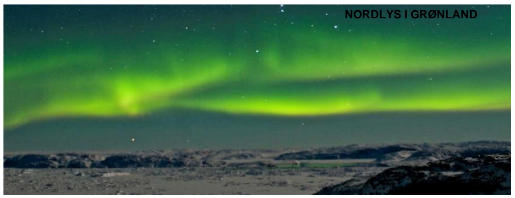
Nordlys over Sermitsiaq fjeldet i Nuuk, nordlys ved Ilulissat