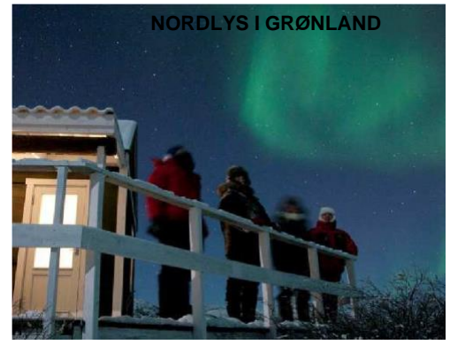
Nordlys over Sisimiut, nordlys over Ilulissat Isfjord, nordlys i Kangerlussuaq