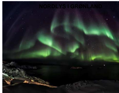
Nordlys over Kangerlussuaq lufthavn (Foto: Mads Pihl), Old Camp i nordlys (Foto: Uri Golman), Sisimiut under nordlysgardin (Foto: Mads Pihl)