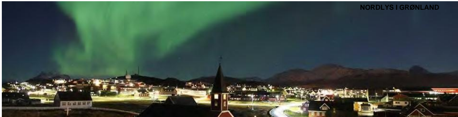
Nordlys over hovedstaden Nuuk