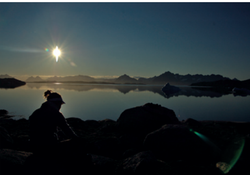
Endnu en smuk morgenstund