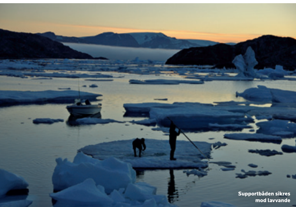
Supportbåden sikres mod lavvande