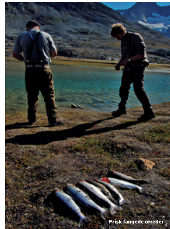
Frisk fangede ørreder

På fjerdedagen, efter en drøj opstigning til dagens sidste pas, får vi endnu et kig bagud, ind over Mittivakkat gletsjerens nordlige ende. Synsvinklen nordfra løser et mysterium, flere af os har grublet over. På østgrønlandsk betyder Mittivakkat "en kvindes bryster". Det bedste bud er, at retten til at navngive i dette tilfælde er tilfaldet en grønlandsk fanger, med længsel i sindet, på