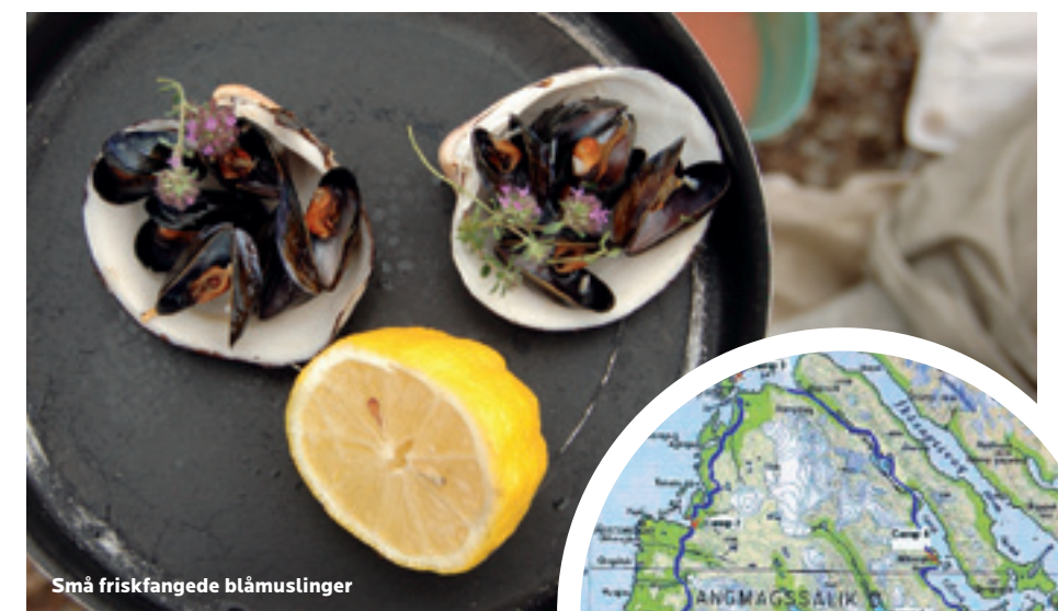
Små friskfangede blåmuslinger