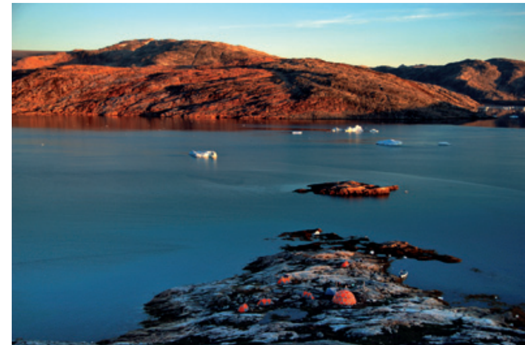
Pynten ved Tiniteqilaaq

Herfra går turen igen sydpå. Vi bliver sejlet