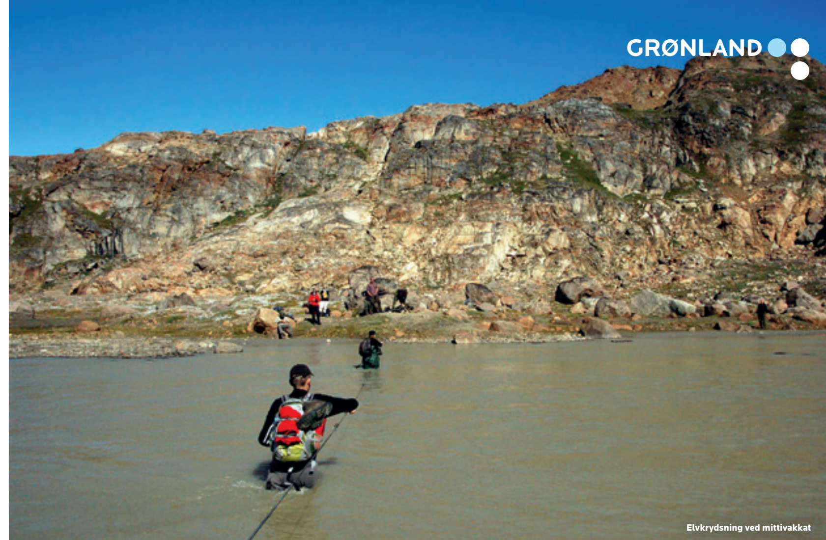
Elvkrydsning ved mittivakkat